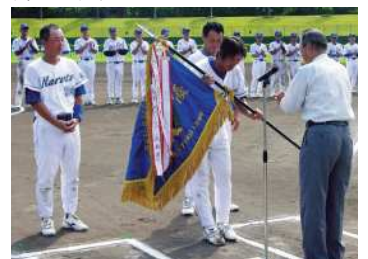
2002年~2006年まで壮年大会で「5連覇」を飾るなど、驚異的な強さを誇った鳴門クラブ