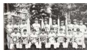
1965年、「日本スポーツ賞」を受賞した日本製鋼所広島