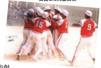
2001年、2002年、2004年と3回にわたり日本ソフトボール協会賞を受賞した岡豊高校