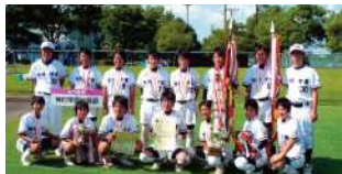
2006年~2009年、全国中学校大会で4連覇を飾った神村学園中等部