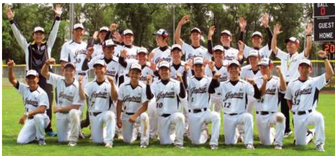
2016年、男子U19日本代表が35年ぶり二度目の「世界一」に輝く！