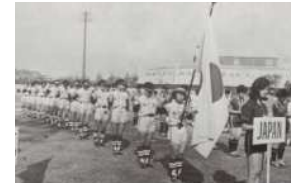
1967年、「日本スポーツ賞」を受賞した京都明德クラブ