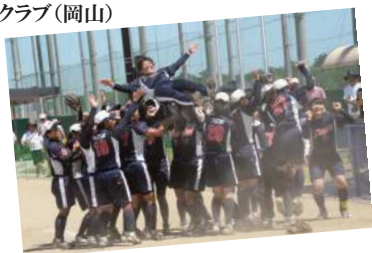
クラブ女子選手権で5連覇を達成。クラブチームとして「初」の1部リーグ昇格を果たすなど、新たな「歴史」を作った大垣ミナモトソフトボールクラブ