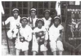
1952年、1956年、1964年に「日本スポーツ賞」、1953年に日本ソフトボール協会賞を受賞した安田女子高校