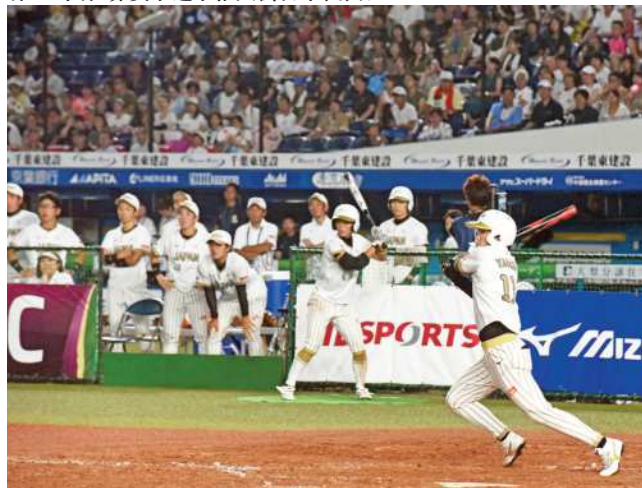
2018年、千葉県下四市で「第16回世界女子選手権大会」を開催