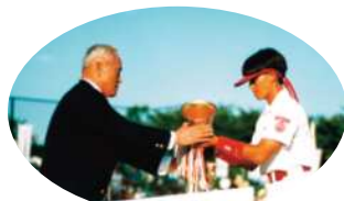
1987年からインターハイ「5連覇」の「偉業」を成し遂げた夙川学院高校

・第39回読売新聞社「日本スポーツ賞」 太陽誘電(群馬) ・日本ソフトボール協会賞 日本体育大学男子チーム(東京) 太陽誘電(群馬) 日立高崎(群馬) 名古屋猪子石小学校(愛知) 夙川学院高校(兵庫)