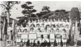
1962年、「日本スポーツ賞」を受賞した宇都宮女子商業高校