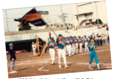
1990年に日本ソフトボール協会賞を受賞したホンダエンジニアリング

・第40回読売新聞社「日本スポーツ賞」 夙川学院高校(兵庫) ・日本ソフトボール協会賞 太陽誘電(群馬) 闘犬センター(高知) 上郷クラブ(長野) ホンダエンジニアリング(埼玉) 夙川学院高校(兵庫)