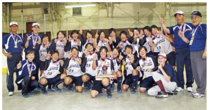
2013年、ジュニア女子の категорияで5度目の「世界一」