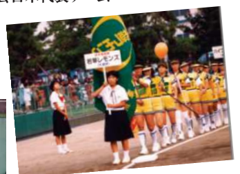
1993年、日本ソフトボール協会賞を受賞した若草レモンズ。「ママさん大会」で活躍

・第43回読売新聞社「日本スポーツ賞」 第4回世界男子ジュニア選手権大会日本代表チーム ・日本ソフトボール協会賞 山形県庁(山形) 闘犬センター(高知) 太陽誘電(群馬) 若草レモンズ(兵庫)