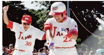
1995年、アジア・オセアニア地区最終予選を勝ち抜き、翌出場権を獲得!

・第45回読売新聞社「日本スポーツ賞」 アトランタ五輪アジア・オセアニア地区最終予選日本代表チーム