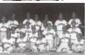
1973年、「日本スポーツ賞」を受賞したレッドスパローズ。翌年のアジア男子選手権にも出場し、準優勝