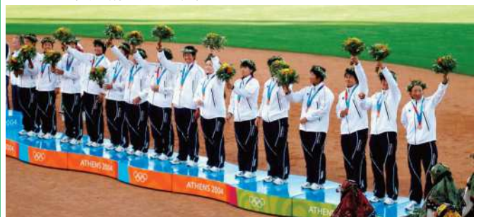
2004年、金メダル獲得を期待されたアテネ・オリンピックは銅メダルに終わる...