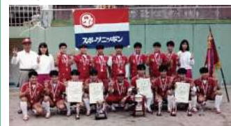
1991年から日本リーグ「3連覇」を果たす等圧倒的強さを誇った太陽誘電