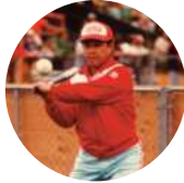
1977年、日本ソフトボール協会賞を受賞した岡賢氏。群馬教員で活躍し、1980年の第5回世界男子選手権大会から3大会連続で男子日本代表の監督を務めた