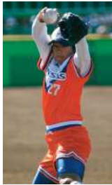
所属チームでも日本代表でも大活躍 所属チームでも日本代表でも大活躍 所属チームでも日本代表でも大活躍