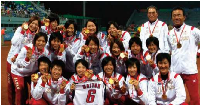
2008年、北京オリンピックで「悲願」の金メダル獲得!