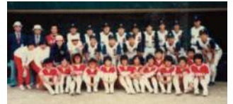
1983年に手にし得る「すべて」の国内タイトルを手にした横尾製作所。この年を最後に惜しまれつつ活動休止