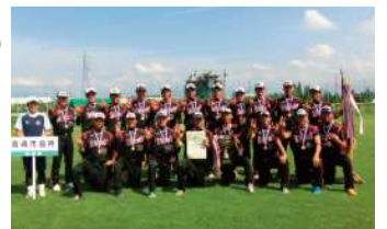
2013年、全日本実業団男子選手権大会で3連覇を飾った高崎市役所