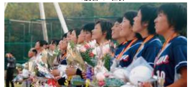
2003年、ジュニアカテゴリーで4度目の「世界一」