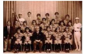
1966年、「日本スポーツ賞」を受賞した高島屋大阪