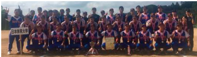
2018年、大学勢として初めて「全日本総合男子選手権大会」を制した日本体育大学