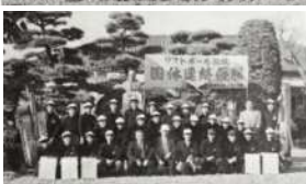
1962年、「日本スポーツ賞」を受賞した日本代表選手団