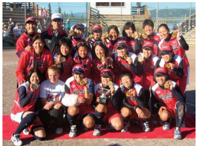
2012年、42年ぶり2度目の世界選手権優勝! 北京オリンピックに続き、「世界の頂点」へ!