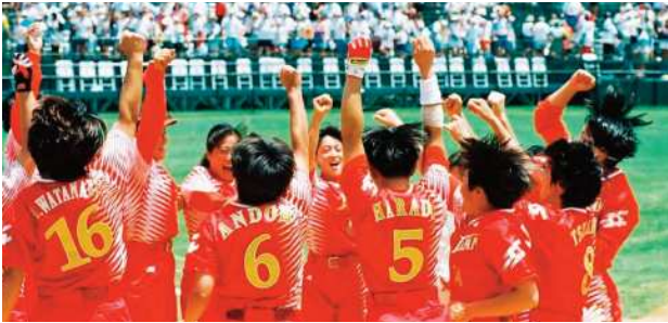
1996年、ソフトボールにとって「初」のオリンピックの舞台となったアトランタ・オリンピック。日本は決勝トーナメント初戦で敗退し、メダルに手が届かず...