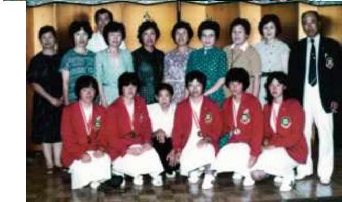
1981年、ジュニアカテゴリー「初」の世界選手権、記念すべき「第1回大会」で男女アベック優勝 横尾製作所(群馬) 日本体育大学女子(東京) 旭化成延岡(宮崎) 日本電装女子(愛知)