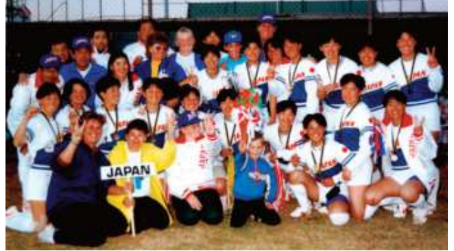
1991年、ジュニア女子の категорияで二度目の「世界一」

・第41回読売新聞社「日本スポーツ賞」 第4回世界女子ジュニア選手権大会日本代表チーム