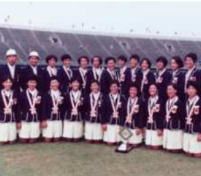
1970年、大阪で第2回世界女子選手権大会を開催。女子日本代表が初の「世界一」に輝く