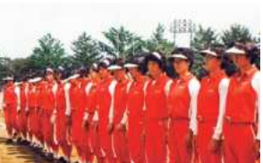
1975年、インカレ3連覇を達成し、日本ソフトボール協会賞を受賞した東京女子体育大学