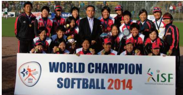
2014年、女子日本代表が「初」の世界選手権「連覇」を成し遂げた