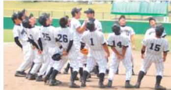
全国高校選抜男子で4連覇を達成するなど、「常勝」チームとして君臨する大村工業高校